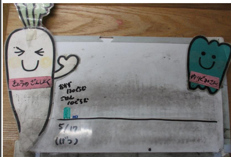
【離乳食】 豚肉の焼き物・白菜の浅漬け・みそ汁